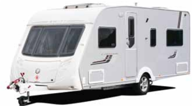
SWIFT - Reisen mit Stil

info@swift-caravan.de www.swift-caravan.de