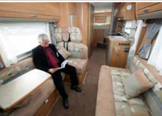
Living Area: Nicht nur Engländer lieben eine große, gemütliche Sitzgruppe.