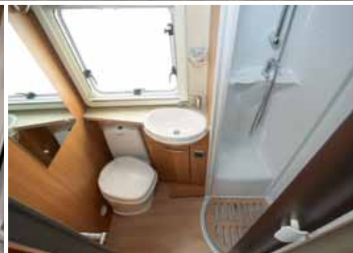
Bathroom: Mit zeitlos ansprechendem Stil gefällt der Sanitärbereich mit Runddusche.