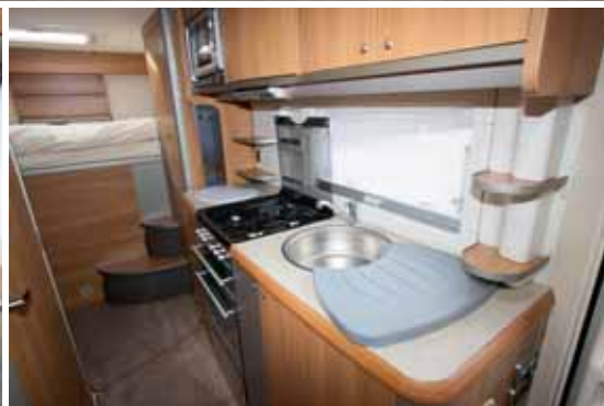
Pantry: Die oftmals unterschätzte britische Küche – zumindest im Kon-Tiki lässt sie kaum Wünsche offen.